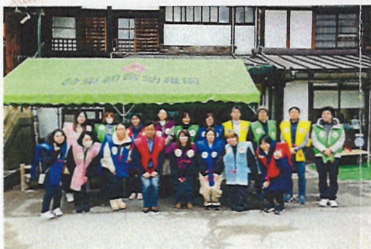
▲お掃除のお手伝いもありがとうございました