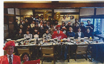
園長先生、還暦のお誕生日おめでとうございます！