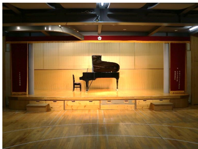
体育館ホール (多目的遊技室)