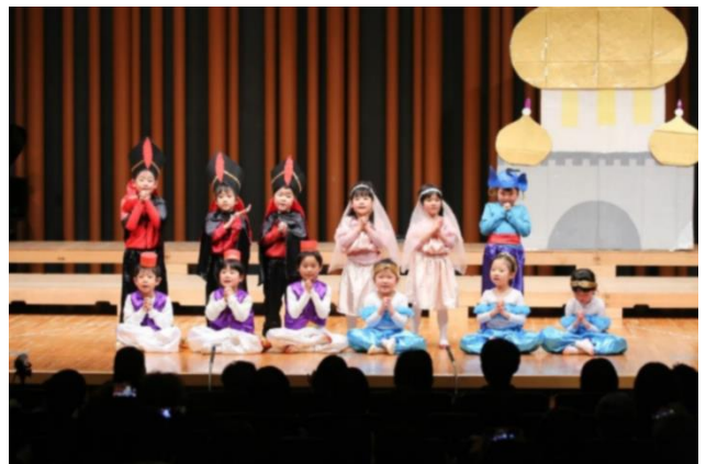
リズム会（表現発表会）