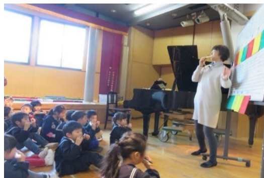
正課 音楽リズム（リトミック）