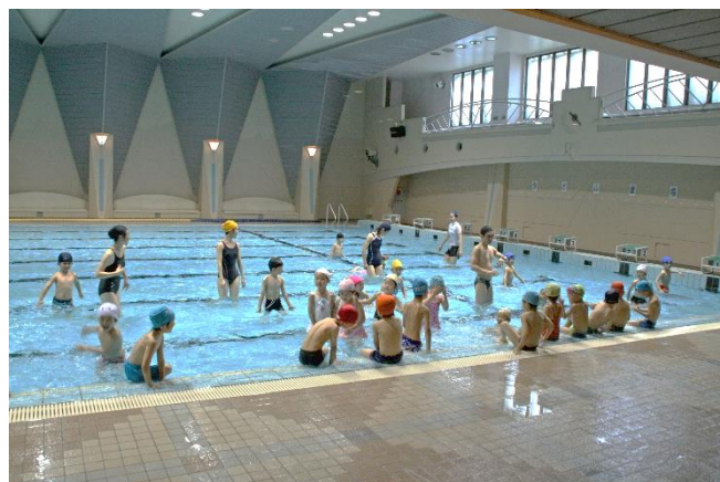
正課体操 水泳練習（清島温水プール）