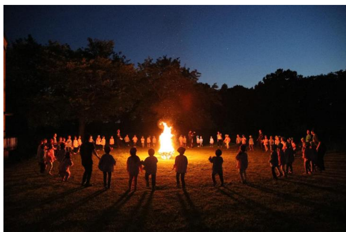
お泊り保育（あすなろの里） キャンプファイヤー

第2学期始業式・秋の遠足（全園児） 祖父母参観会食会・身体測定 親子ふれあい給食