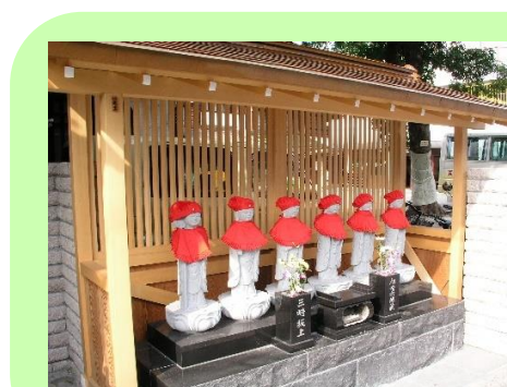
幼稚園門脇の六地藏さま