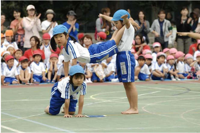
運動会 年長児組体操