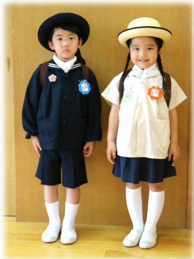
冬服（左） ・ 夏服（右）